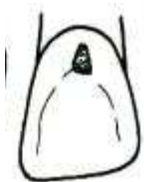
Cavidade de cl. ____

De acordo com a classificação de Black para as cavidades, assinale a alternativa que contém a seqüência correta.