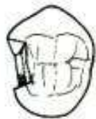
Cavidade de cl. ____